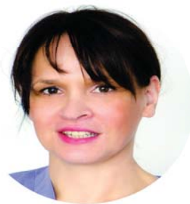
проф. Ивана Милетич Хърватия