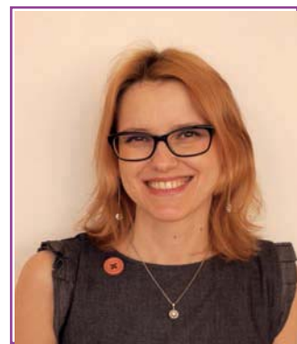
Лектор: д-р Теодора Йорданова

3. Практическа част – разчертаване на профилна телерентгенография на пациенти на участниците, определяне на костна възраст, тип растеж и интерпретация на данните. Допълване на информацията с анализ на ортопантомография по отношение на наличие на хипододонтии, хиперодонтии, ретинирани зъби и положение на мъдреците.